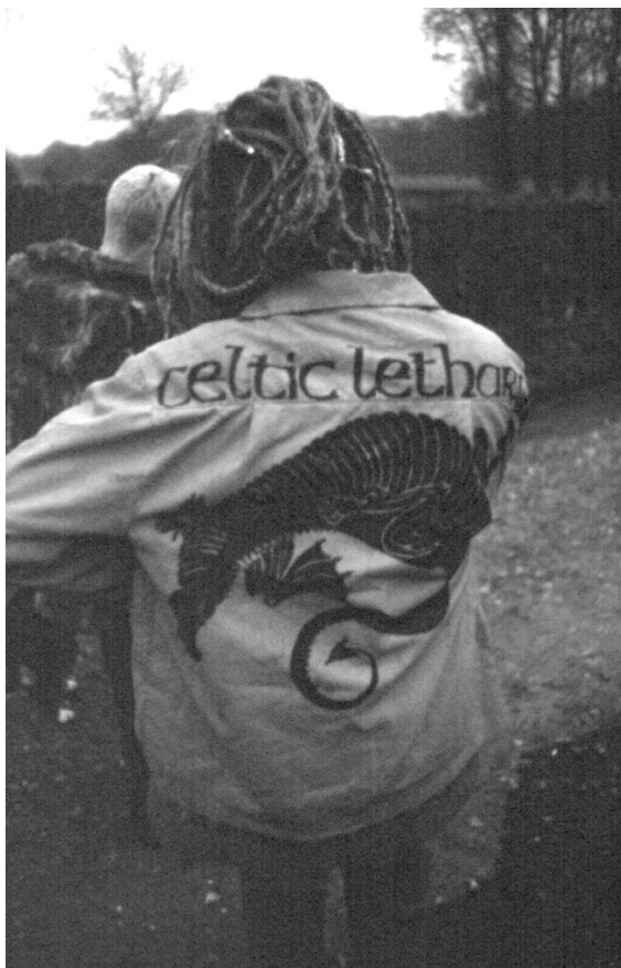
Celtycki symbol smoka – wiosenny festiwal w Newbury.

pierwszych rytów naskalnych, poprzez Drzewo Wiadomości Dobrego i Złego w Starym Testamencie po szamańskie drzewo łączące świat ziemski z światem duchów. Ów symbol jest obecny w wielu religiach i kulturach. Dla ruchu ekologicznego drzewo jest ikoną natury. Jest obrazem idealnej formy i świętej istoty. Drzewo traktuje się jako byt odczuwający, w tym kontekście próby jego obrony – jako żywej istoty – wydają nam się bardziej zrozumiałe. W przypadku ekowojowników szacunek dla drzewa przejawia się m.in. podczas budowy domów usytuowanych wśród jego konarów. Elementy konstrukcyjne mocowane są za pomocą lin, z pominięciem gwoździ. Ekowojownicy dbają o to, aby nie skaleczyć, nie uszkodzić drzewa. Drzewo staje się