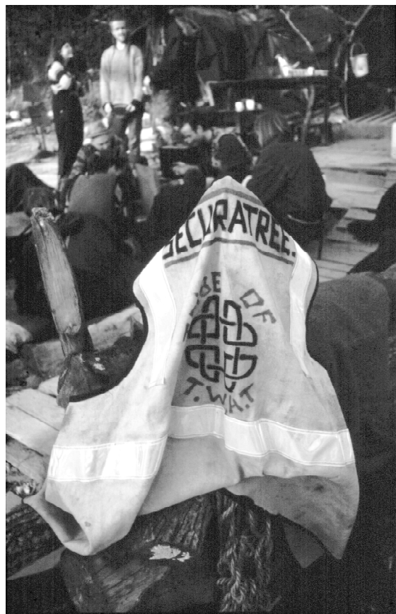
Kamizelka pracowników ochrony autostrady z motywem plecionki oraz napisem SECURE-TREE - Fairmail.

Drzewo od zawsze zajmuje istotną rolę w kulturze człowieka. Począwszy od