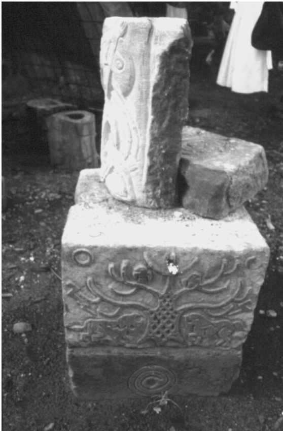
Motyw drzewa wyrzeźbiony w kamieniu – Pollock Free State .

rzystywanych przez ogólnie rozumiany ruch alternatywny. W szczególności przez niezwykle prężnie działający w Wielkiej Brytanii ruch New Age . Najczęściej wykorzystywanymi symbolami są: wszelkiego rodzaju spirale, koła, plecionki celtyckie, krzyże oraz motywy roślinne (kwiaty, liście etc.). Większość z interesujących nas emblematów została bezpośrednio zapożyczona z symboliki ludów historycznych: kultur megalitycznych, Celtów oraz Indian. Jednoznaczne określenie źródła pochodzenia symbolu jest prawie niemożliwe przede wszystkim ze względu na mnogość przeróbek i przekształceń wzorów. Również