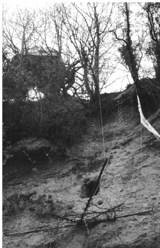
Wejście do tunelu usytuowane w skarpie – obóz Cliff Richard .