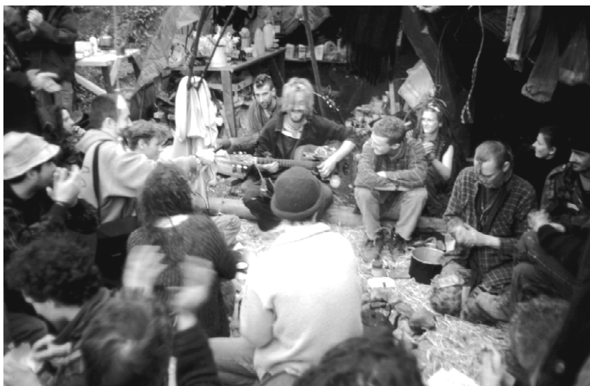
Wspólne muzykowanie w Wild Garlick .

Własną specyfikę posiadał także Wild Garlick . Nazwa powstała na zasadzie wolnego skojarzenia, od rosnącego wokół dzikiego czosnku. Obóz ten zamieszkiwali aktywiści o zamiłowaniach artystycznych. Będąc wydawcami wewnętrznego biuletynu informacyjnego pełnili rolę łącznika pomiędzy pozostałymi obozami. Mieszkańcy Wild Garlick zainicjowali sesję nagraniową piosenek Road Protesters następnie wydanej jako benefit na rzecz kampanii. Kolejny – Zion Tree składał się z czterech domów na drzewach oraz tunelu. Nad brzegiem rzeki powstawał Water Rats , obóz o otwartej formule – miejsce wieczornych spotkań i rozrywki, chętnie odwiedzany przez pozostałych uczestników protestu, jak i gości. Szóstym z obozów