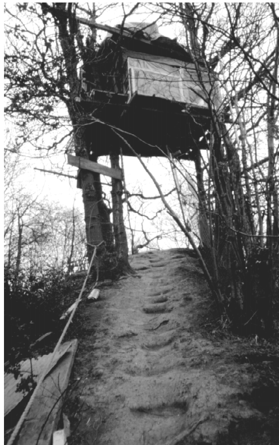
Dom na drzewie usytuowany nad ścieżką łączącą obóz Cliff Richard i FlyingWood.

Przedstawione powyżej kampanie lokalne na rzecz obrony środowiska naturalnego miały miejsce w latach 1993-1997. Głównym celem tych kampanii było zablokowanie inwestycji związane z budową nowych dróg i niszczeniem terenów zielonych. W wyniku zainicjowania protestów, rozwinął się ruch Road Protesters , zjawisko kulturowe posiadające spójny, wywodzący się z tradycji kontrkulturowych światopogląd, sprecyzowane cele, interesująca taktykę i niekonwencjonalne sposoby działania.