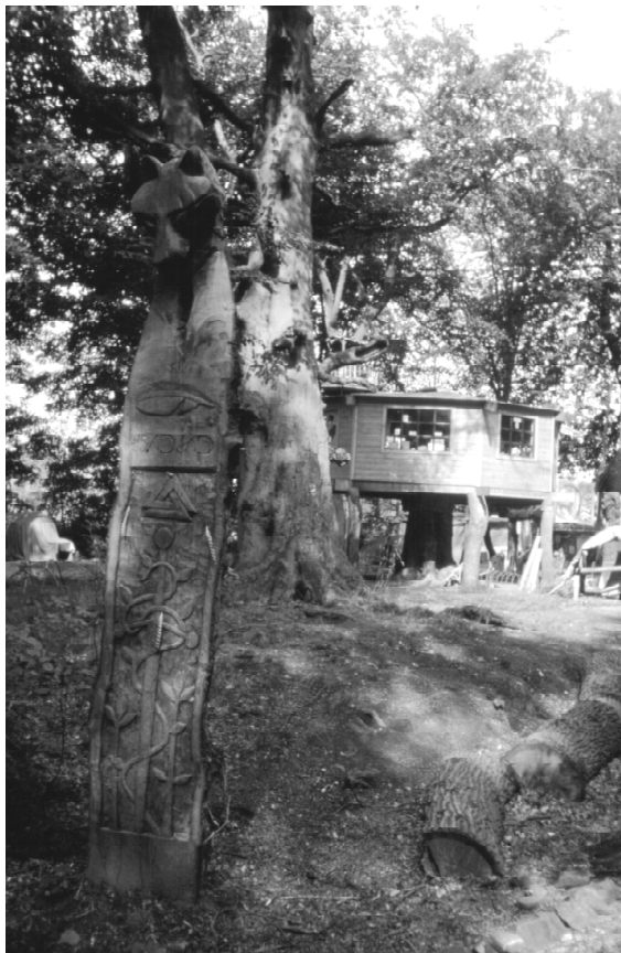
Drewniany totem z Pollock Free State

w akcję edukacyjną. Powstał Pollock Free University . Na miejscu zaczęli pojawiać się uczniowie z okolicznych szkół, dla których organizowano lekcje edukacji ekologicznej.