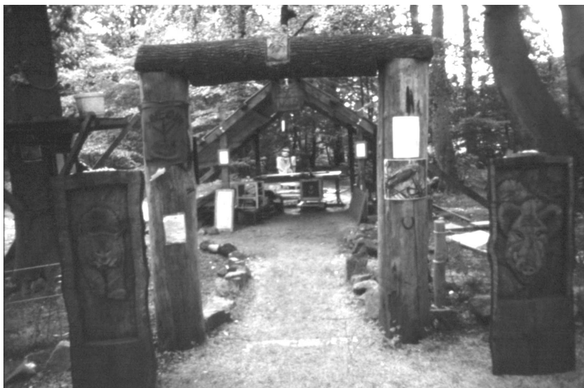
Jedna z czterech bram prowadzących na teren obozu w Pollock Free State

drogi. Wiosną 1994 roku na teren planowanej inwestycji, budowy autostrady M77 wkraczają ekolodzy z Glasgow. Argumentem ekologów jest to, iż obszar przeznaczony pod autostradę pierwotnie przekazany został organizacji National Trust for Scotland przez pry-