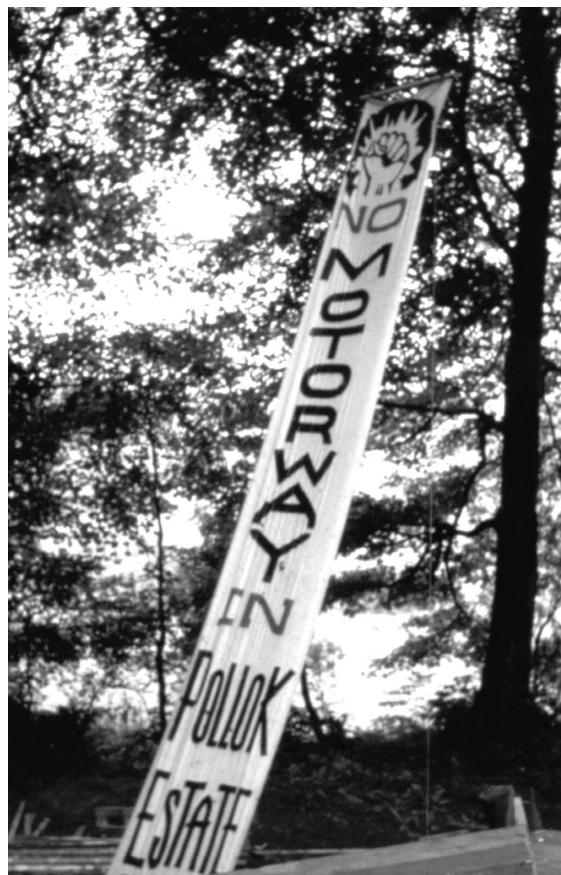
Nie dla autostrady ! – transparent z Pollock Free State .

Wraz z upływem czasu formuła działania Pollock przerodziły się z aktywnego protestu