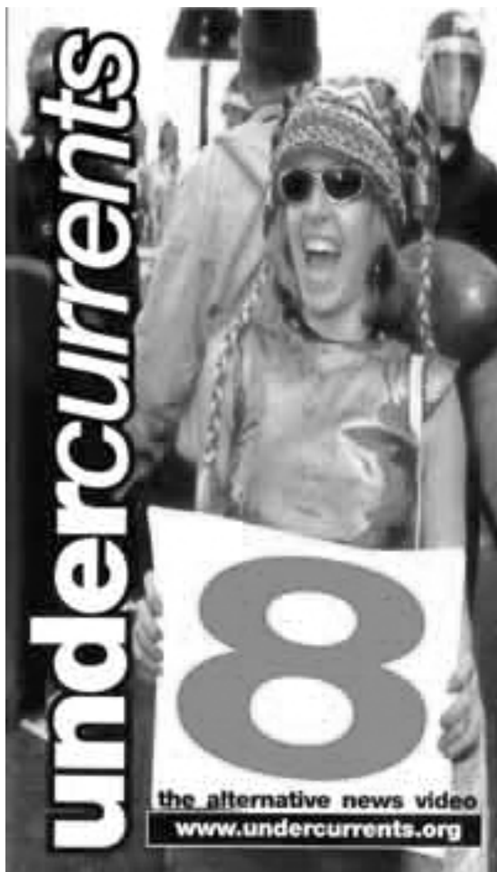
Okładka jednej z kaset VHS wydawanej przez kolektyw Undercurrents .

29. Thomas Harding, The Video Activist Handbook , Pluto Press, London.Chicago. Illinois, 1997, s. 9.