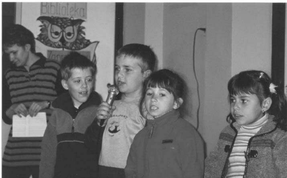
Najmłodszy uczestnicy konkursu piosenki ekologicznej zachęcają do ochrony środowiska

Cel ogólny - uczniowie po przeprowadzonej lekcji powinni: