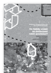
1 egz. Co każdy uczeń ze śmieciami robić powinien? Dla nauczycieli, 0 zł