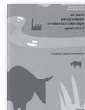
egz. Co warto przedszkolakom o środowisku naturalnym opowiedzieć?, 0 zł