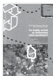
1 egz. Co każdy uczeń ze śmieciami robić powinien? Dla uczniów, 0 zł