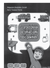
1 egz. Co przedszkolak ze śmieciami robić powinien?, 0 zł