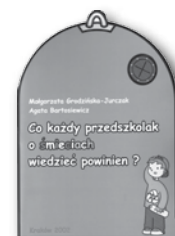
egz. Co każdy przedszkolak o śmieciach wie?dzieć powinien?, 10 zł