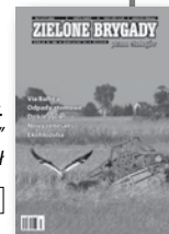
„Zielone Brygady. Pismo Ekologów” nr 3 (217)/2006, 5 zł