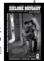
„Zielone Brygady. Pismo Ekologów” nr 5 (219)/2006, 5 zł