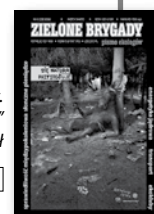
„Zielone Brygady. Pismo Ekologów” nr 6 (220)/2006, 5 zł